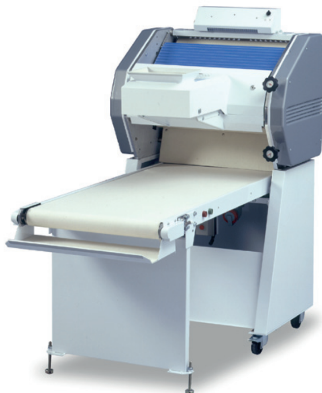
Podstavec s dopravníkovým pásem TE