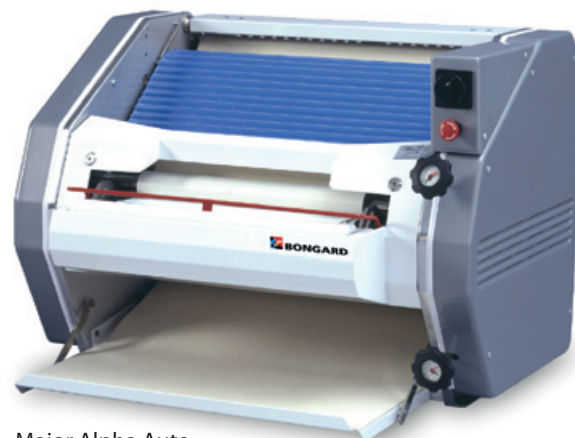
Major Alpha Auto