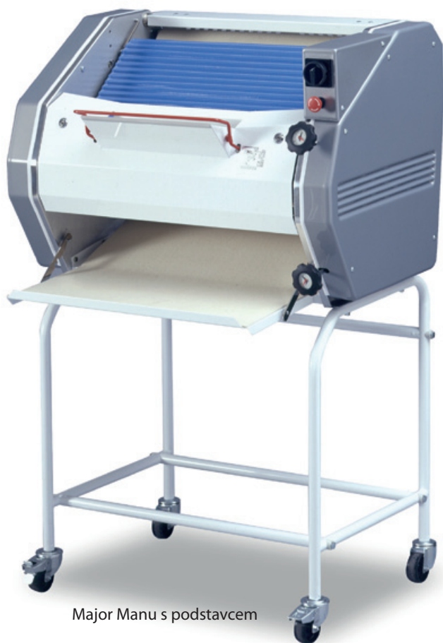
Major Manu s podstavcem