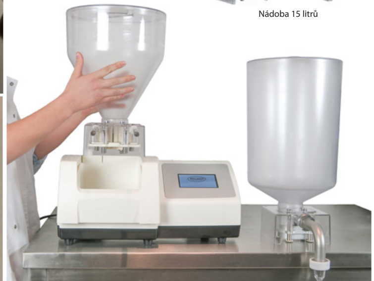
Nádoba 15 litrů