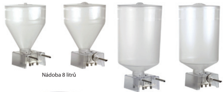
Nádoba 8 litrů