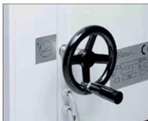
Rychlost dělení lze nastavit od 650 do 1800 klonků za hodinu.