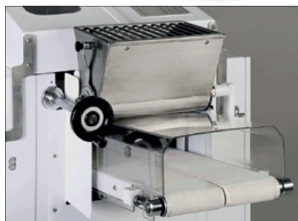
2-řádkový přední výstup a nerezový zaprašovač mouky