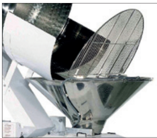
Kruhový koš s výklopným roštem.