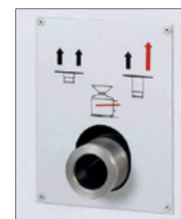
Dvě pozice pro nastavení rychlosti pásu.