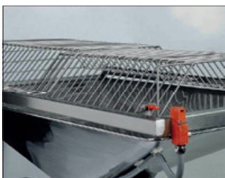
Obdélníkový koš s posuvným roštem.