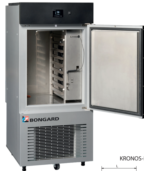
KRONOS-P - 46.5