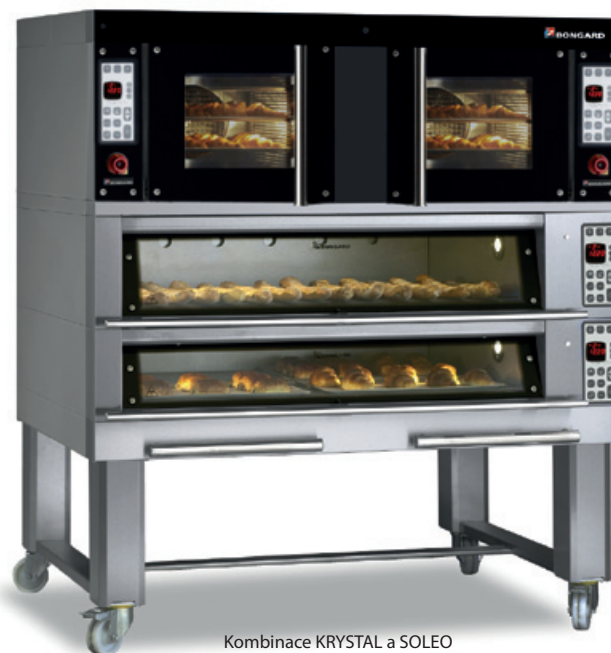
Kombinace KRYSTAL a SOLEO